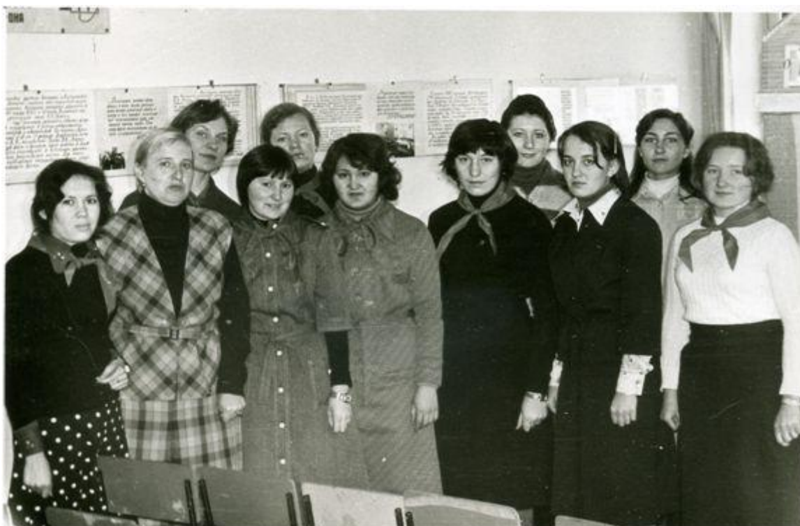
Инструктивный сбор вожатых