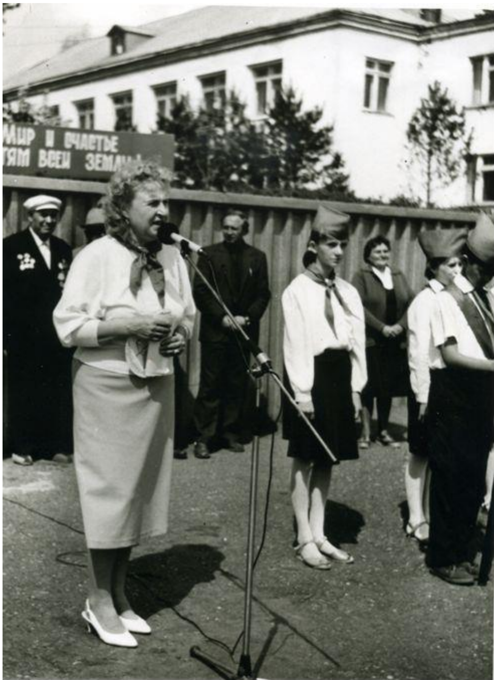
Сбор по приёму в пионеры