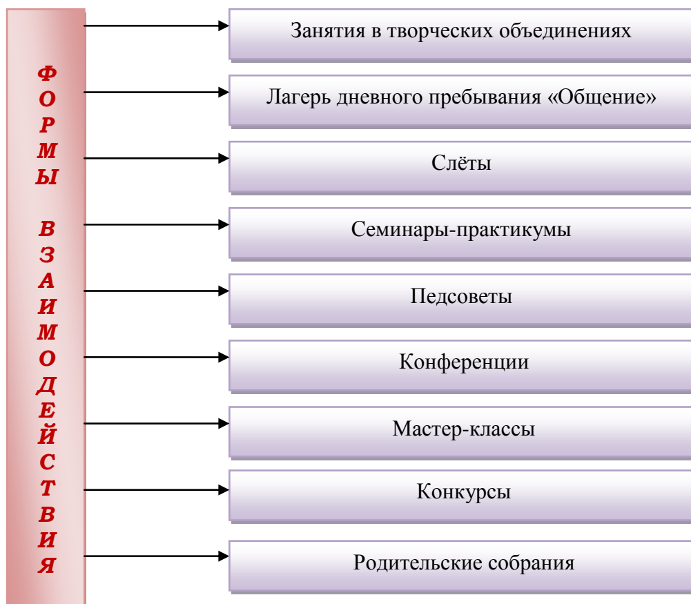
Схема 4. Формы взаимодействия «Центра развития» с образовательными учреждениями.