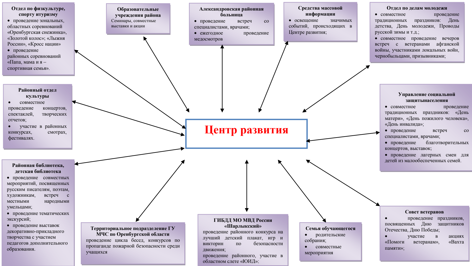
Схема 2. Система социального партнерства