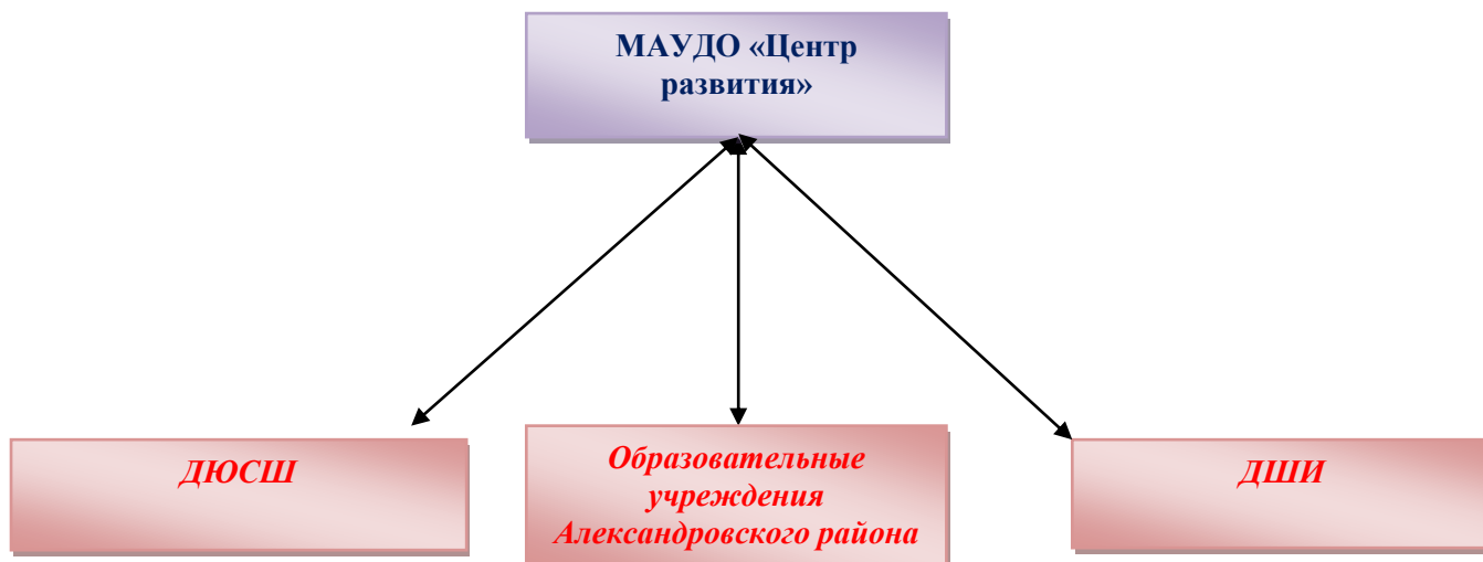
Схема 3. Модель интеграции общего и дополнительного образования